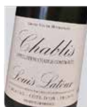
Chablis Louis Latour Chardonnay D.O. Francia