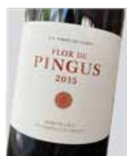
Flor de Pingus 100% Tempranillo D.O. Ribera del Duero