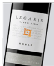
Legaris Roble Tempranillo D.O. Ribera del Duero Copa 5.50 euros 21.00 euros