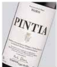
Pintia Tinto fino D.O. Toro