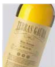
Albariño Terras Gauda Albariño D.O. Rías Baixas