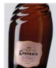
Ars Collecta Rosé Gran Reserva Brut