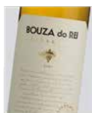
Bouza do Rei Albariño D.O. Rías Baixas