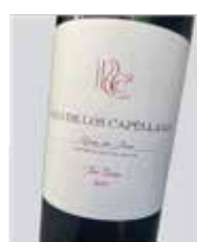
Pago de los Capellanes Tempranillo D.O. Ribera del Duero