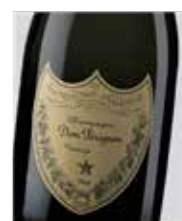
Dom Pérignon Vintage Brut Pinot Noir y Chardonnay D.O. Francia