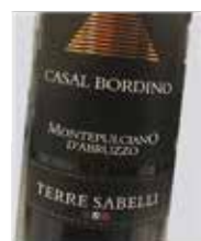
Montepulciano D'Abruzzo Terre Sabelli