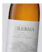
A Vilerma Treixadura, Albariño, Godello Loureira, Lado y Torrontés D.O. Ribeiro