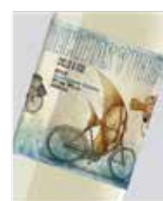
Bicicletas y Peces Sauvignon blanco D.O. Rueda