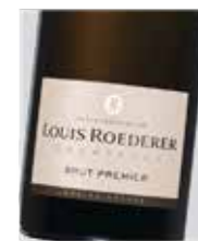
Louis Roederer Brut Premier Brut D.O. Francia