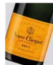
Champagne Veuve Clicquot Pinot Noir, Chardonnay, Pinot Meunier D.O. Francia