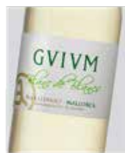
GVIVM Blanc de Blancs D.O. Mallorca