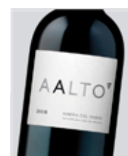
Aalto Tempranillo D.O. Ribera del Duero