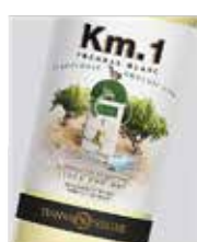
Km. 1 Prenal Blanc I.G.P. Mallorca