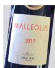
Malleolus 100% Tempranillo D.O. Ribera del Duero