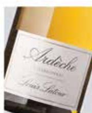
Ardèche Louis Latour Chardonnay D.O. Borgoña