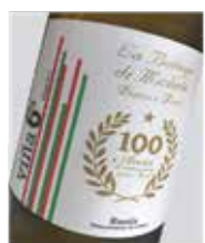
Yllera Viña 65 100 aniversario Verdejo D.O. Rueda