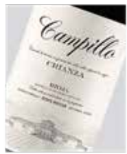
Campillo Crianza Rioja Tempranillo D.O. Rioja