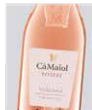
Cà Maiol Roseri Cà Maiol Roseri Sangionese, Barbera, Merlot, Marzemino D.O.C. Chiaretto del Garda