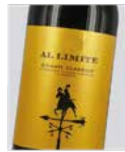
Al Limite Chianti Classico D.O. Chianti