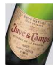
Cava Juvé & Camps Reserva de la Familia Brut Nature D.O. España