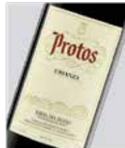
Protos crianza Tinto fino D.O. Ribera del Duero