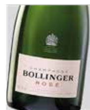
Bollinger Rosé Pinot Noir, Chardonnay y Pinot Meunier D.O. Francia