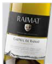
Raimat Chardonnay D.O. Penedés