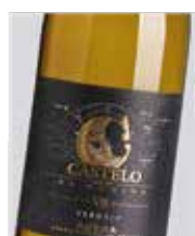
Castelo de Medina Verdejo D.O. Rueda