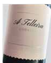
A Telleira Godello D.O. Ribeiro