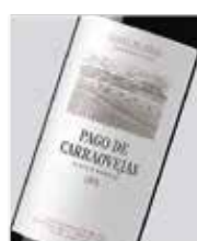
Pago de Carraovejas Tinto 2015 Tinta fina, Cabernet y Merlot D.O. Ribera del Duero