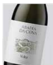
Abadía Da Cova Volta Godello, Albariño, Treixadura, Branco, Lexítimo D.O. Ribeira Sacra