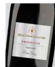
Prosecco Maschio dei Cavalieri Glera D.O. Italia