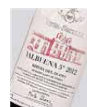
Valbuena Tinto fino (tempranillo) D.O. Ribera del Duero