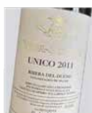
Vega-Sicilia Unico 100% Tempranillo D.O. Ribera del Duero