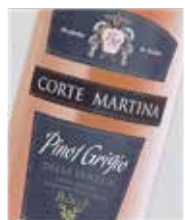
Pinot Grigio Blush Delle Venezie