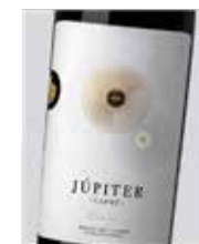
Júpiter Carmé 100% Tempranillo D.O. Ribera del Duero