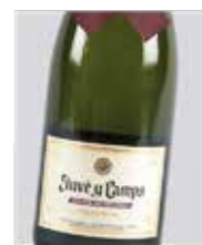
Cava Juvé u Camps Cinta púrpura Parellada, Xarel-lo, Macabeu D.O. Penedés