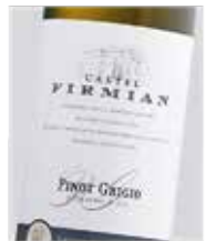
Pinot Grigio Blanco Pinot Grigio D.O. Trentino