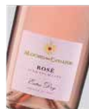
Prosecco Maschio dei Cavalieri Rosé Pinot Noir, Rondinella D.O. Italia