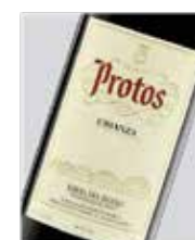
Protos crianza Tinto fino D.O. Ribera del Duero