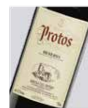
Protos reserva Tinto fino D.O. Ribera del Duero